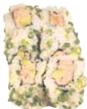
THON MAYO AVOCAT