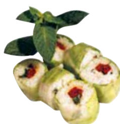
TOMATE SÉCHÉE CHEESE BASILIC