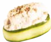
CONCOMBRE POULET MAYO 6,00 €