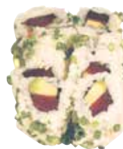
THON CRU AVOCAT