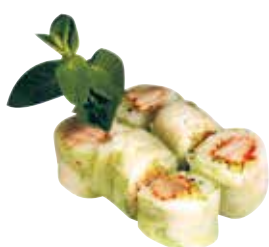
THON CUIT ÉPICÉ CONCOMBRE