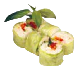
TOMATE MOZARELLA BASILIC