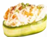
CONCOMBRE TARTARE SURIMI 6,00 €