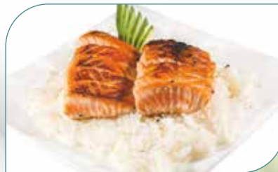
SHIRASHI SAUMON CUIT