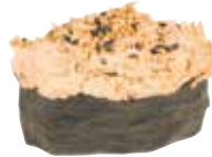
THON MAYONNAISE 5,50 €