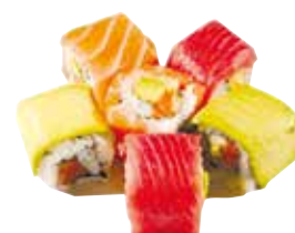
COLOR FRESH *

CALIFORNIA SAUMON RECOUVERTS DE SAUMON, THON, AVOCAT 7 PIÈCES - 8,00 €