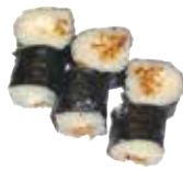
CHEESE OIGNONS FRITS