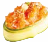
CONCOMBRE TARTARE SAUMON 6,00 €