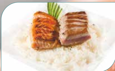
SHIRASHI MIXTE CUIT