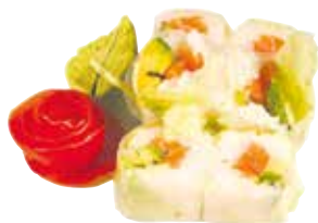
AVOCAT SAUMON CONCOMBRE

Feuille de riz et salade verte / SERVIS PAR 6 SAUF *