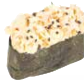
POULET MAYONNAISE 7,00 €