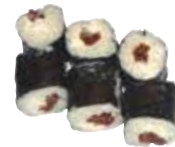
TOMATE SÉCHÉE CHEESE