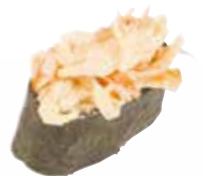
TARTARE SURIMI 6,00 €