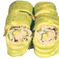
THON MAYO AVOCAT