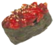
TARTARE THON 8,00 €