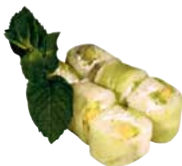
AVOCAT CHEESE CONCOMBRE