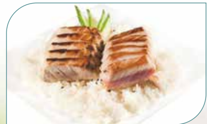
SHIRASHI THON CUIT