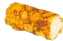
OMELETTE 4,00 €