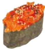
TARTARE SAUMON 6,00 €