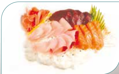
SHIRASHI 16 PIÈCES