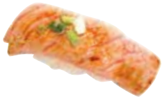
SUSHI FLASH SAUMON - 5,50 € THON - 7,00 €