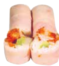
BEIGNET DE POULET AVOCAT