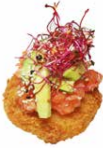
TARTARE DE SAUMON

Boulette de riz croustillant avec base d'avocat, graines de betterave germées, sésame / SERVIS PAR 2