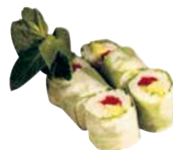
THON CRU AVOCAT CONCOMBRE