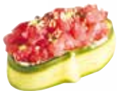
CONCOMBRE TARTARE THON 8,00 €